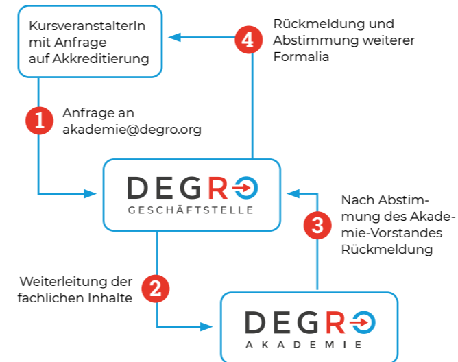
Abb. 3 Der Antrag auf Akkreditierung wird über mehrere Schritte durch die Geschäftsstelle und Akademie der DEGRO bearbeitet.

Ab sofort können Weiterbildungsveranstaltungen im digitalen Format auch akkreditiert werden, sofern diese die Kriterien erfüllen. Der Antrag muss einen ausgefüllten Fragenkatalog sowie den vorläufigen Programm-Flyer beinhalten.