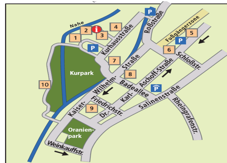
3- Haus des Gastes