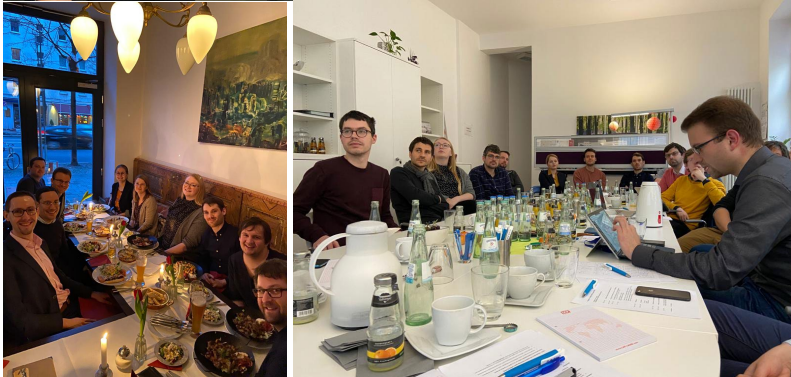
(obere drei Bilder: DKK 2020 in Berlin, untere Bilder: "Get-together"- jDEGRO Retreat; jDEGRO Retreat in der Geschäftsstelle der DEGRO in Berlin)